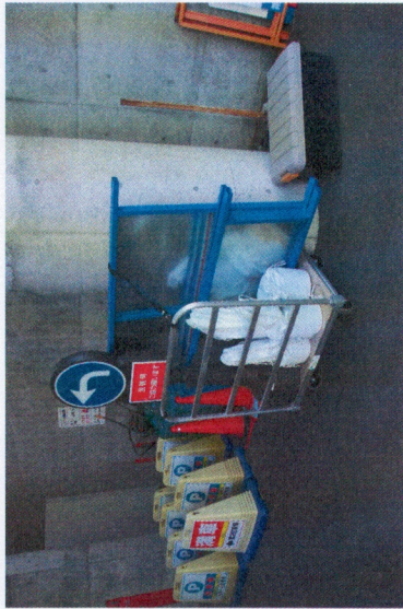
看板①、②、⑥、⑦ 手前→看板②&砂袋5個 奥→看板①、⑥、⑦(一番奥に看板⑥)

《看板BOXへの戻し方》 ※下記の図のとおり戻してください。なお、全て看板BOXへ積んだあと、ゴムで2か所とめてください。