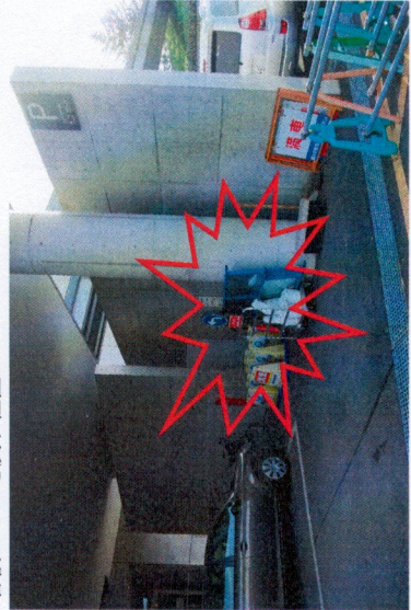
看板①、②、⑥、⑦ ※大ホール関係者通用口付近