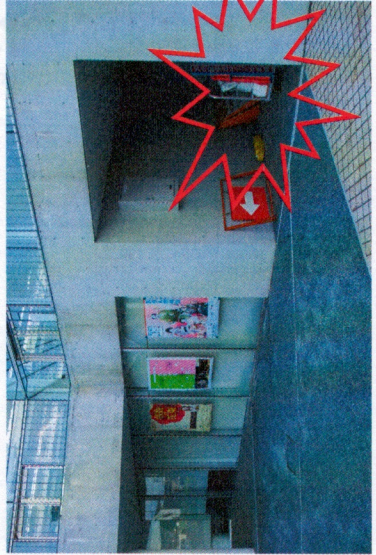
看板③～⑤ ※正出入口右手通用口付近