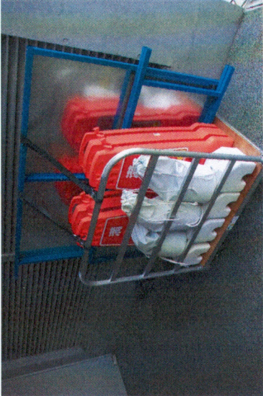
看板③～⑤ 手前下→重石4個 手前上→砂袋3個 真中→看板③4個 奥→看板④、⑤(一番奥に看板⑤)